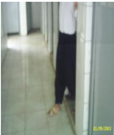
بىروانە و پىنەكە ←

دەیفەر موو: (غُفْرَانَكَ) واتە: خوايە لىم خۆشبە .