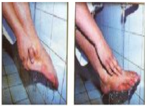
پروانە وىنەكە ←

(إِذَا تَوَضَّأْتَ فَخَلَّلِ الْأَصَابِعَ) (۱) واتە: ئەگەر دەست نويژت شۆرى بو نويژ، ئەوا پەنجەکانى دەستت بخەرە ناو پەنجەکانى پىتەوہ .